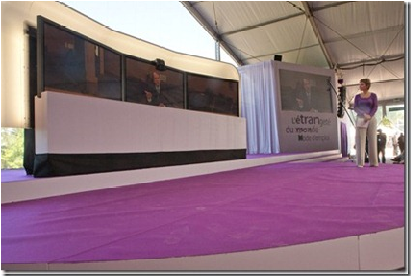
Table ronde “Business Oriented”