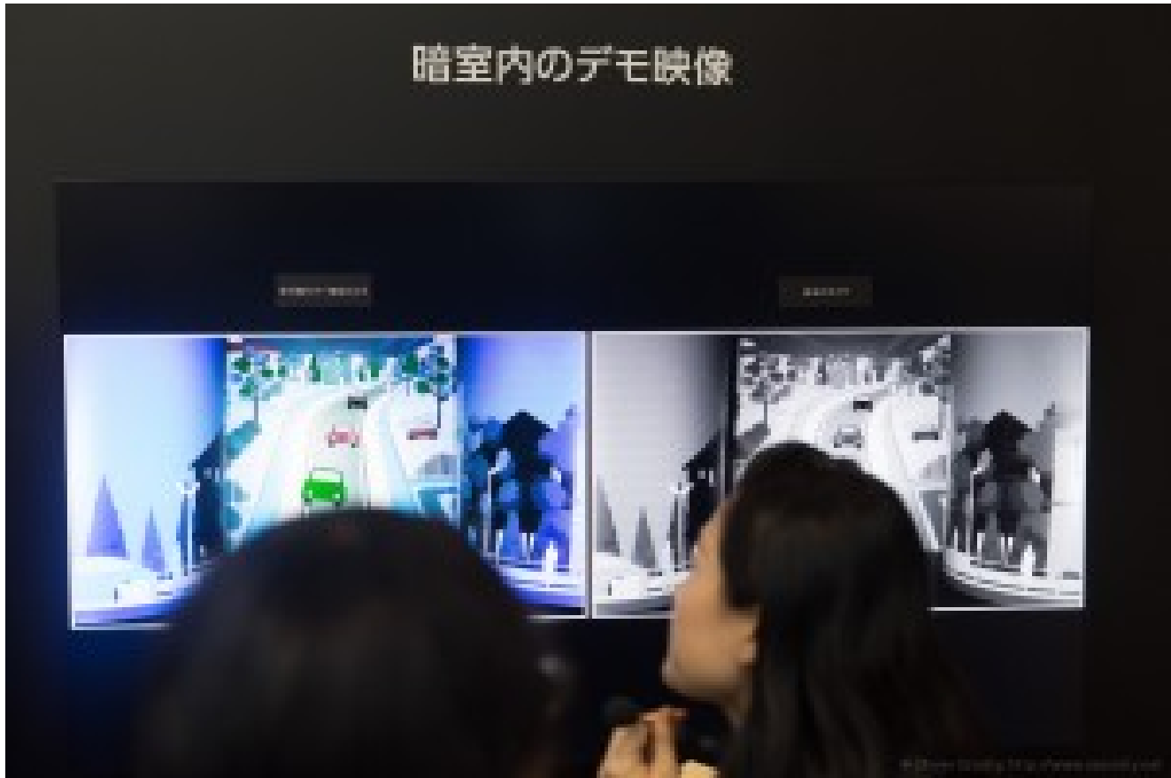
Démonstration de vision nocturne en couleur chez Sharp avec une caméra infrarouge. A gauche son rendu et à droite le rendu d'une caméra infrarouge classique. Reste à comprendre comme cela fonctionne et si cela fonctionne bien en cas réels au-delà de la démonstration !

Pioneer annonçait un partenariat avec Audi pour ses R8 avec l'ambition de créer des voitures à conduite automatique, mais sans plus de précisions sur le stand.