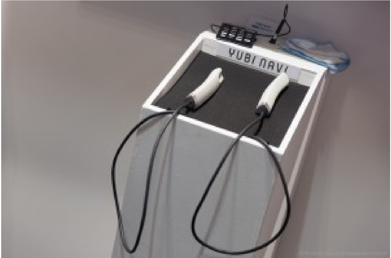
Curieux dongle que ce Yubi Navi de DoCoMo. Il permet d'obtenir un retour mécanique de la part de son mobile, par exemple pour indiquer la direction à prendre dans ses déplacements.

DoCoMo présentait son curieux Yubi Navi , une sorte de manette dont l'intérieur est motorisé et se tortille à gauche ou à droite et au milieu, ce qui permet une communication bidirectionnelle : on peut l'utiliser comme télécommande gyroscopique et elle est capable de se tordre dans un sens ou l'autre. Exemple d'application : indiquer où il faut tourner dans la rue, pourquoi pas pour les aveugles. C'est du bizarre. Du bizarre qui n'ira probablement pas bien loin.