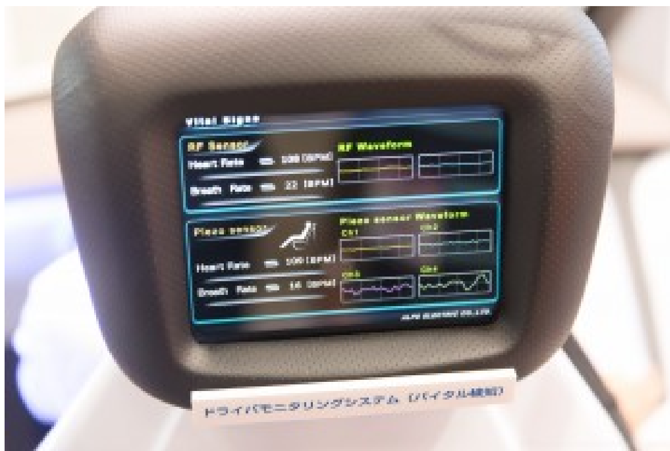
Démonstrateur de rendu de capteurs biométriques intégrés dans le siège conducteur chez Alps. Pour capter pouls et rythme respiratoire et détecter des anomalies.

Chez Alps , des capteurs intégrés dans le siège captent même le pouls et le rythme respiratoire du conducteur, là aussi pour servir de nounou et recommander au conducteur de se reposer si nécessaire. Cette manie de vouloir mettre des capteurs partout ! Mais c'est compréhensible... pour un fabricant de capteurs !