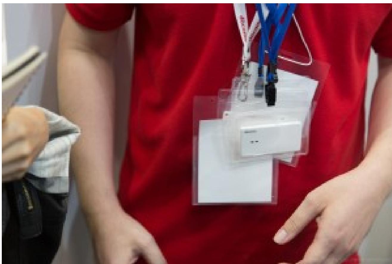
La portable SIM est la carte blanche portée par le démonstrateur. Elle permet d'avoir accès à son abonnement 3G/4G à partir de n'importe lequel de ses mobiles à portée de main. Avec certainement un bout de logiciel associé.

L'opérateur mobile DoCoMo démontrait sinon sa " Portable SIM ", un lecteur de cartes SIM mutualisable par des différents mobiles. Ainsi, plus besoin d'avoir une carte SIM pour chaque smartphone ou tablette connecté que l'on trimballe avec soi. Cela permet de tous les utiliser pour la téléphonie et se substitue dans une certaine mesure aux fonctions de routeur Wi-Fi intégrées dans les smartphones ou dans des boîtiers dédiés à cette fonction.