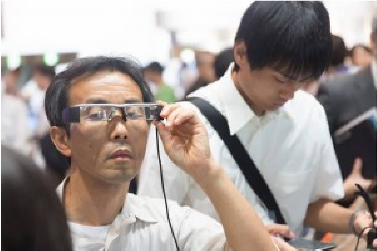
Pas toujours bien pratiques ni esthétiques ces lunettes de réalité augmentée, ici chez Epson.

On peut cependant débattre de l'angle de vue des lunettes qui est faible (13°) sur les Google Glass et meilleur dans ces solutions alternatives. Les variantes se situent essentiellement là. Comme elles tournent sous Android, les scénarios applicatifs sont les mêmes d'une paire de lunettes à l'autre.