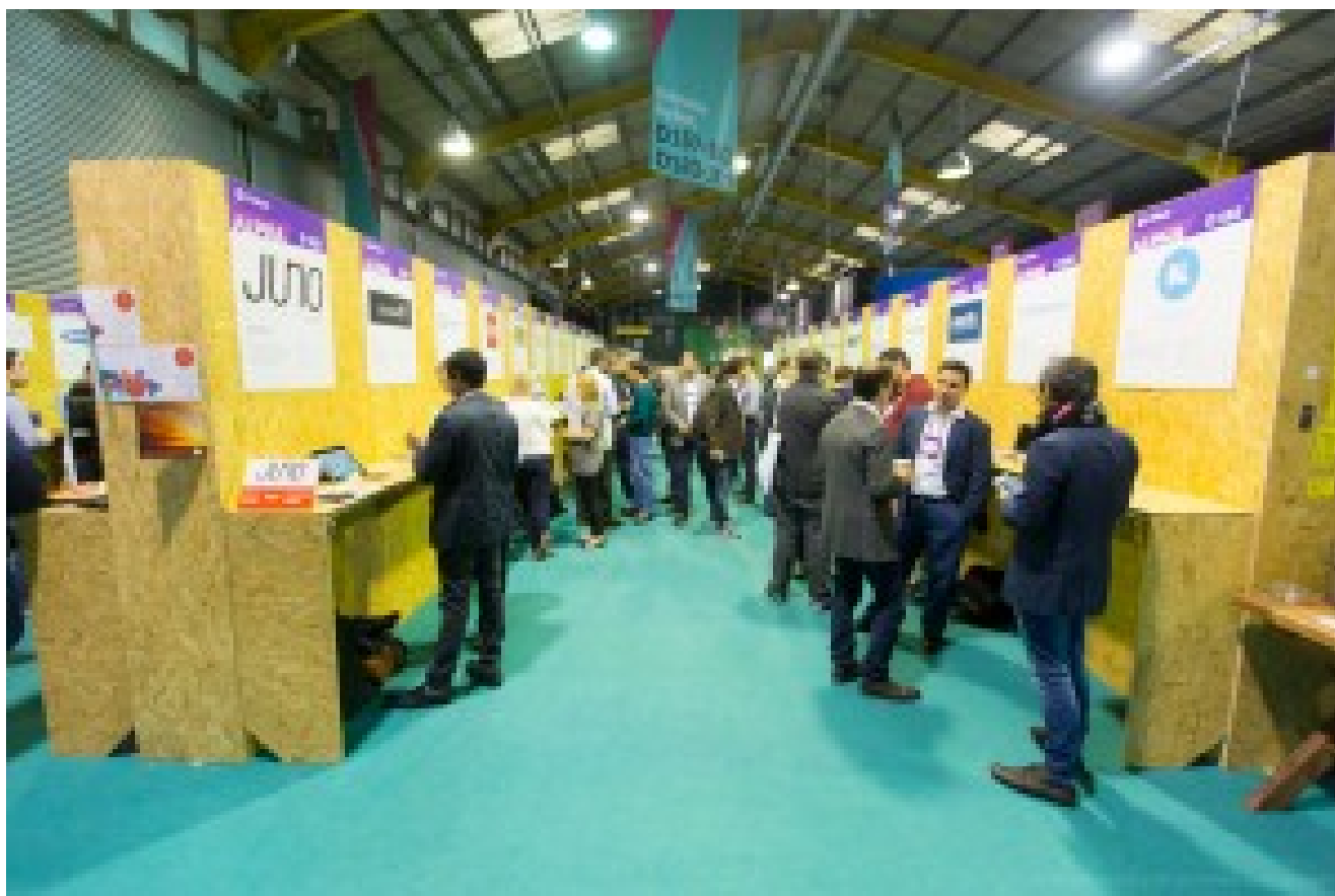
Les stands de startups "Alpha" ou "Beta" du Web Summit, la portion la plus congrue qui soit !

L'événement appliquait à ces startups le principe du Minimum Viable Product (MVP) pour leurs stands. On ne peut pas faire plus dépouillé ! En tout, à peine trois mètres carrés de bois aggloméré osb – qui coûte moins de 10€ en grande distribution – et un panneau standardisé de format A2 avec le logo de la société, une tag line plus courte qu'un tweet sur trois à quatre lignes, une URL, le pays d'origine et un Twitter ID. Et pour poser ses éléments de démonstration et goodies, une planche de 40cm par 1m de large ! A charge pour les startups de se débrouiller pour attirer les visiteurs. Le plus important pour elles était de bien décrire leur solution en quatre lignes. Et ensuite, de créer des animations avec déguisements, bonbons, démonstrations et tout le toutim.