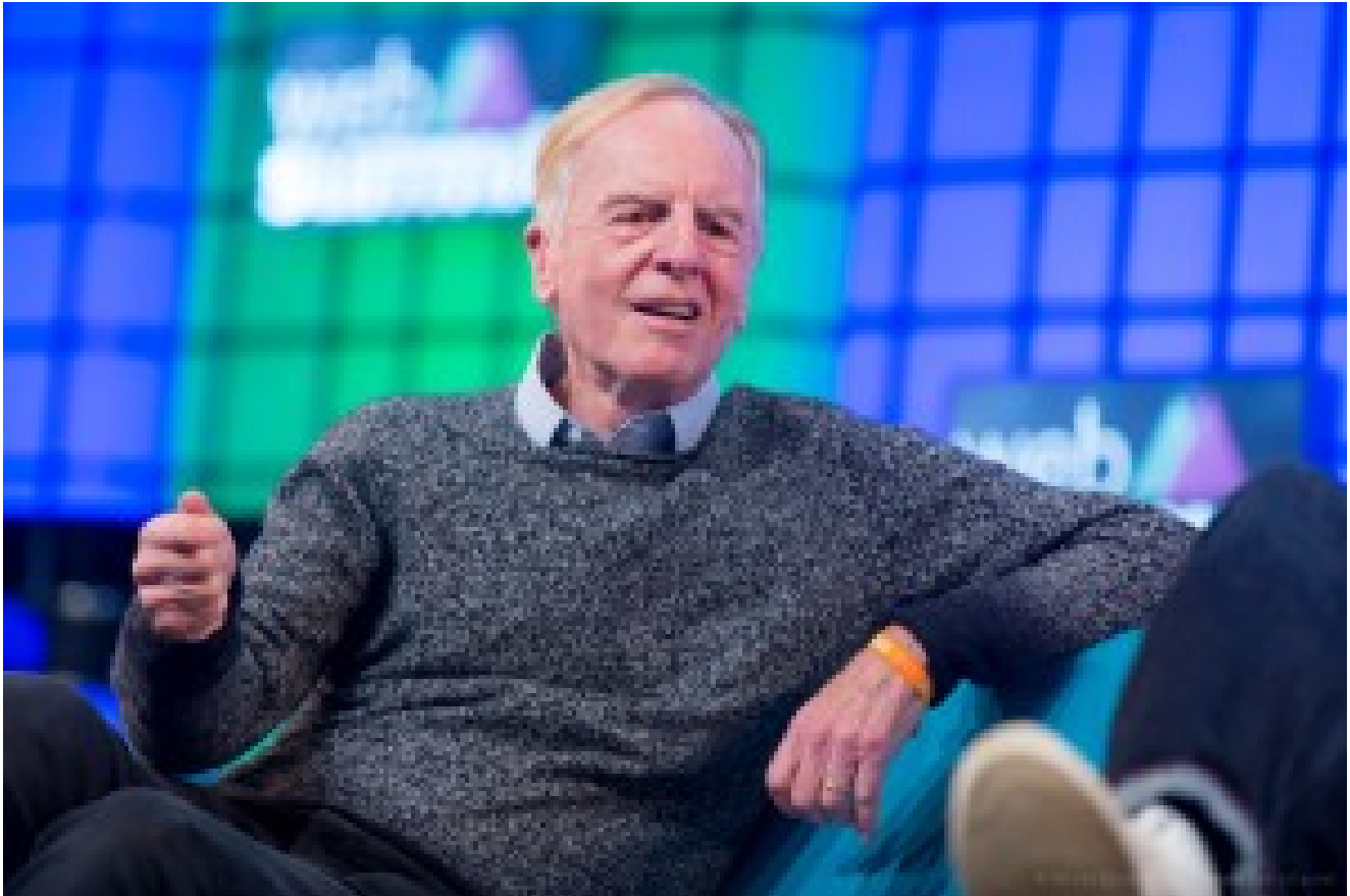
John Sculley, le successeur de Steve Jobs à la tête d'Apple en 1985, maintenant entrepreneur et notamment créateur de Obi Mobiles, qui propose des smartphones pour les pays émergents.

Les formats sont tous courts, comme sur TEDx, sauf que là, on n'apprend pas grand chose et la valeur émotionnelle des contenus est très faible. Plus d'une fois sur deux, il s'agit d'un dirigeant de groupe ou de startup qui fait son marketing.