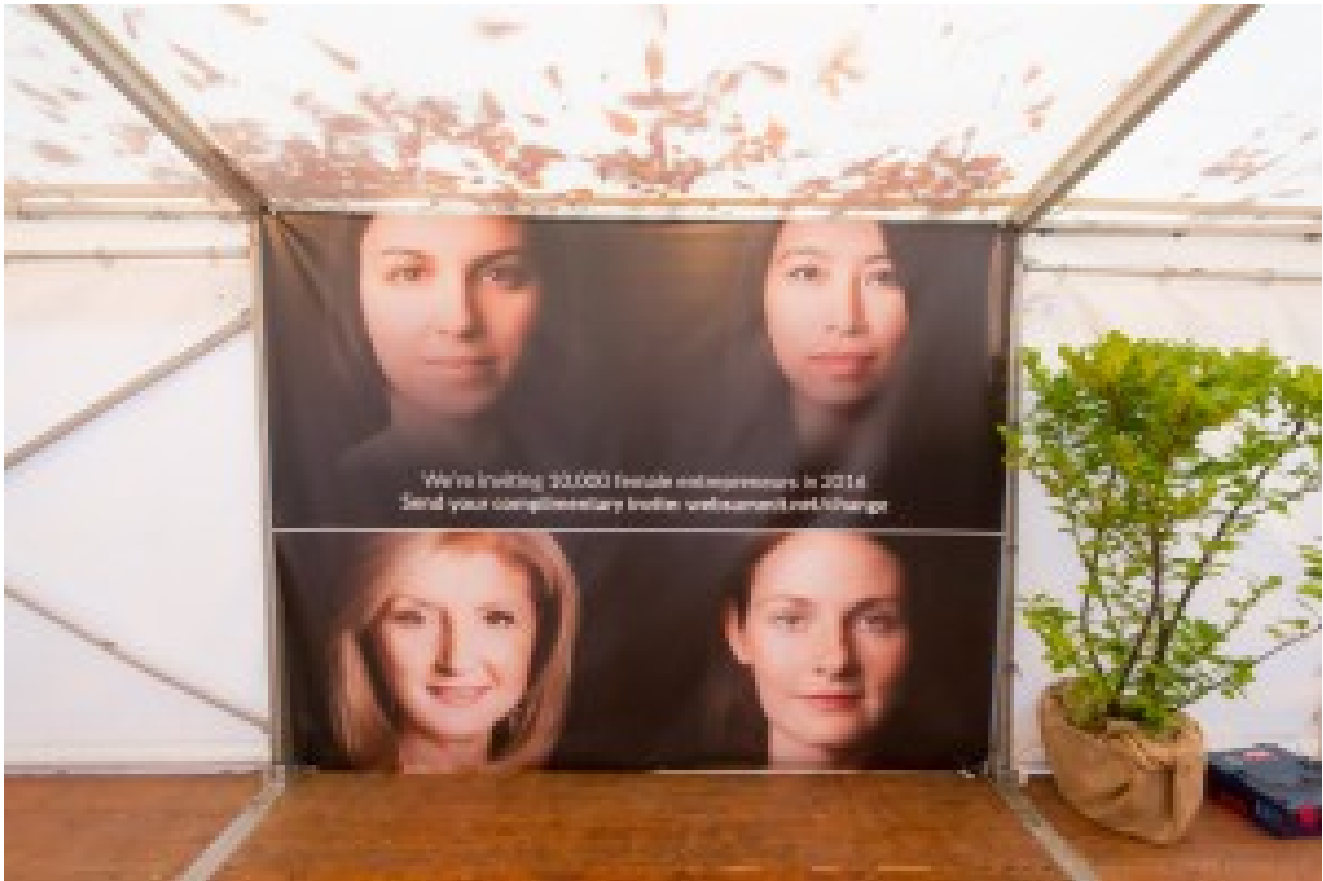
10 000 femmes de la tech pourront obtenir leur place gratuite au Web Summit de Lisbonne en novembre 2016. Une première en matière de discrimination positive de ce genre.

Le Web Summit est aussi plein de défauts, mais qui n'ont pas l'air d'empêcher sa croissance !