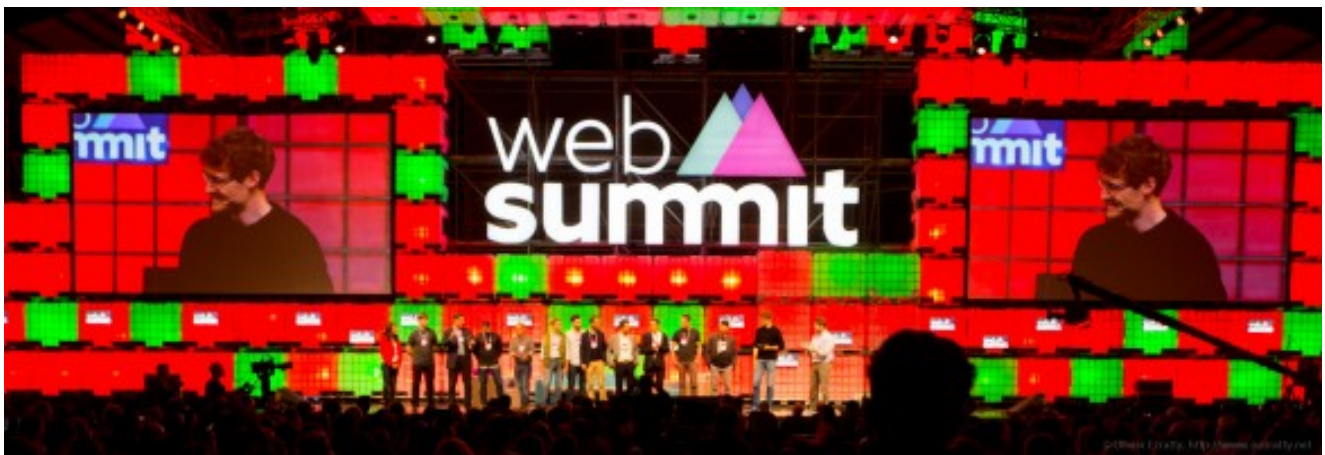
La grande scène de la session plénière, ici avec Paddy Cosgrave accueillant les startups mises en valeur l'année précédente.

Cet événement né en 2010 était au départ une réunion de startups locale de Dublin de quelques centaines de personnes comme il en existe dans toutes les grandes villes. Lancé sur une croissance exponentielle, c'est devenu une place de marché géante rassemblant un nombre record de startups en amorçage ou en phase de croissance, des investisseurs, des médias et des entreprises. Un véritable rouleau compresseur !