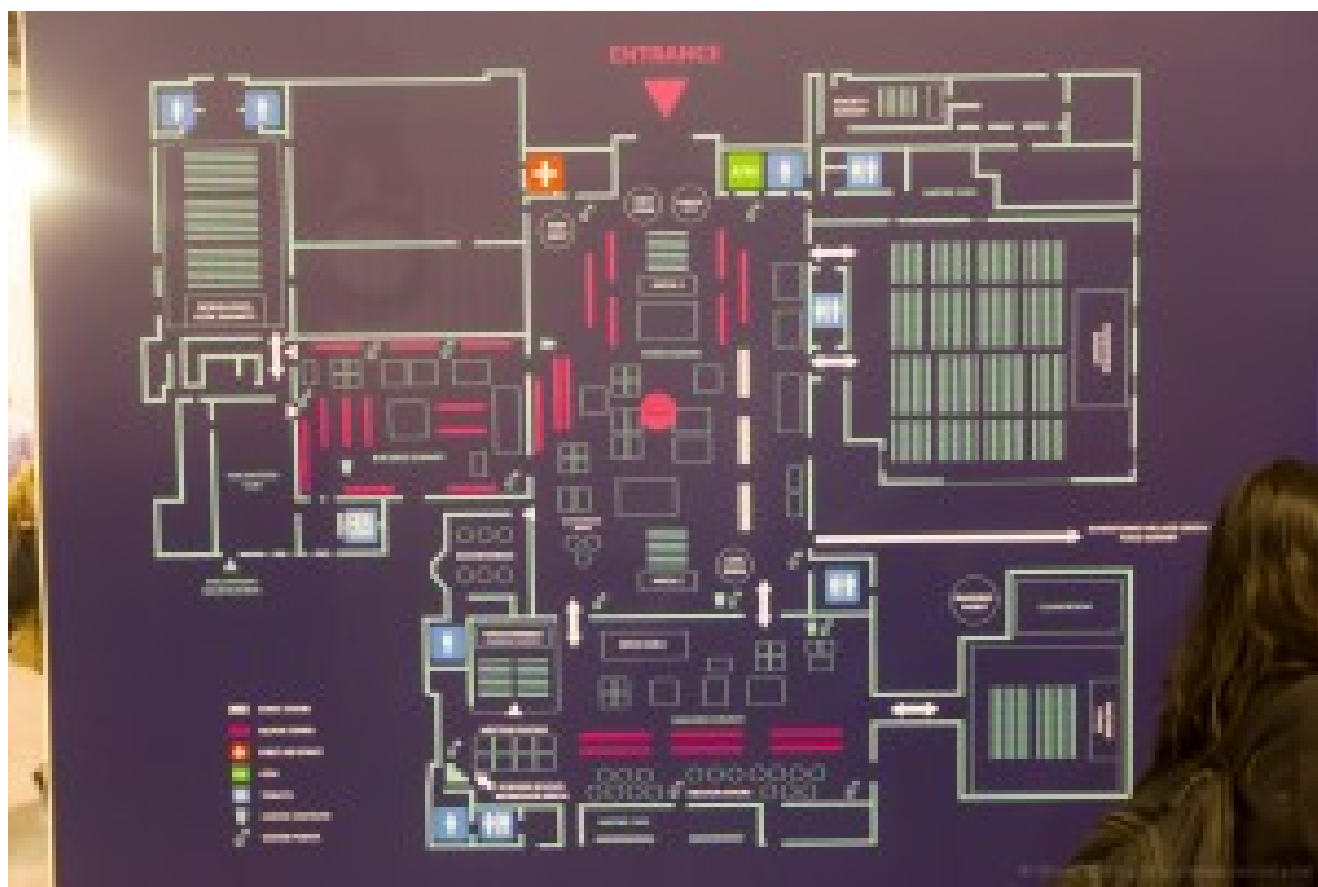
Le plan d'une des deux zones du Web Summit. Les startups sont positionnées dans les parties indiquées en rouge.

Les startups exposantes sont classifiées dans trois catégories : Alpha pour l’émergence, Beta pour les premières levées de fonds et Start pour celles qui ont commencé à décoller. La catégorie Alpha dominait largement en volume avec des projets issus du monde entier avec une diversité jamais vue. Malgré le supposé tri des startups qui exposent, réalisé parmi 60 000 candidates selon les organisateurs, la qualité des projets était évidemment variable. Certaines semblaient avoir été choisies uniquement pour augmenter le compteur du nombre de pays représentés, comme Baboon , une startup qui propose la livraison de repas en Albanie et au Kosovo !