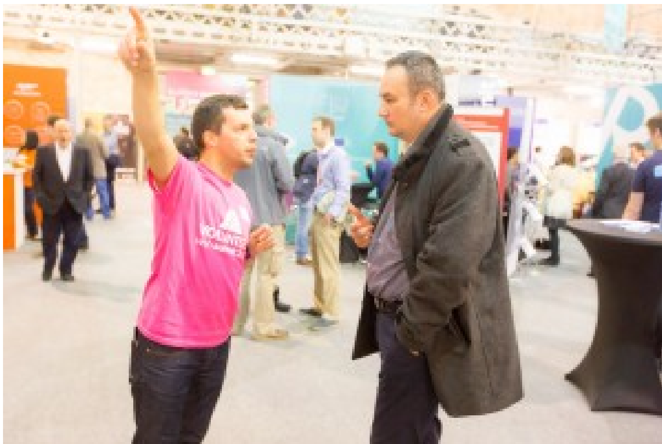
Le Web Summit s'appuie sur 500 bénévoles pour renseigner les participants, pour l'accueil, pour le vestiaire, les réseaux sociaux, etc.

L'événement porte résolument une ambition mondiale sans limites, avec la capacité à attirer des participants et startups issus du monde entier, même issues des USA (surtout hors Silicon Valley). En 2014, 35% des participants provenaient des USA, 45% d'Europe, 9% et 15% du reste du monde. En comparaison, la dernière édition de Le Web attirait 9% d'américains.