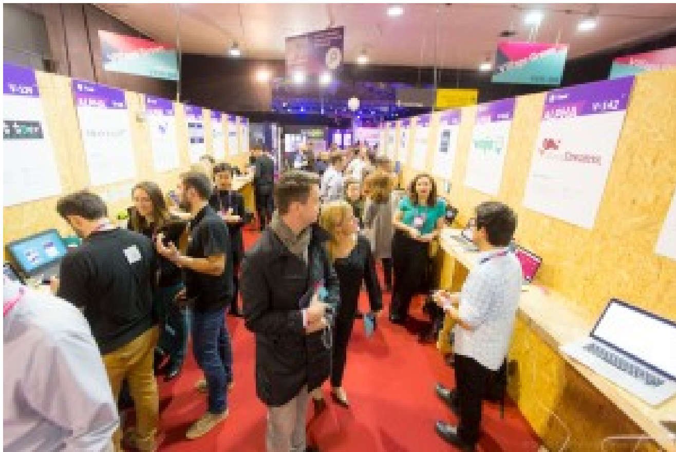
Une disposition typique des stands de startups. Ici, on peut encore circuler. Mais à certains endroits et moments, ce n'était plus vraiment le cas !

Les sessions plénières étaient assez ennuyeuses malgré des intervenants parfois prestigieux. Elles enfilait des formats convenus avec une dominante de tables rondes, de débats avec un journaliste voire de quelques keynotes. C'est d'ailleurs en invitant des journalistes de médias prestigieux à intervenir qu'ils s'en attirent les faveurs ! Rien de moins que CNN, The Guardian, Wired, Financial Times, Bloomberg, CNBC, Wall Street Journal, Forbes, Techcrunch, Reuters, CNET et Re/Code !