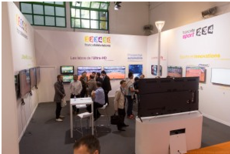
Le stand de France Télévisions est situé comme chaque année dans le RG Lab en sous-sol. Les autres exposants ? Surtout Babolat et Engie.