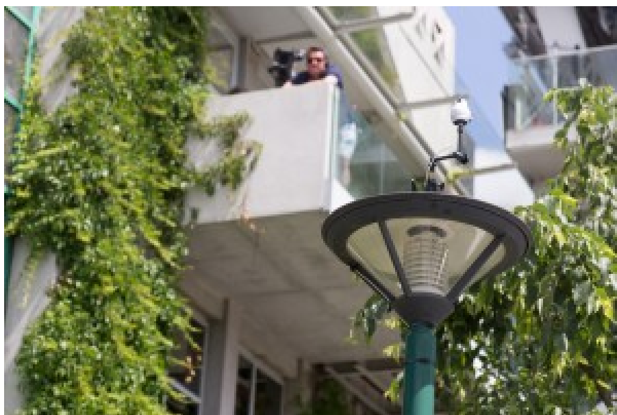
La caméra Giration posée sur un lampadaire et entourée de téflon blanc pour résister au climat breton de Roland Garros

La captation de vidéos à 360° n'est pas une nouveauté en soit. Mais sa mise en œuvre dans l'expérimentation de Roland Garros valait le détour. Elle était réalisée avec des caméras du lillois Giroptic (j'avais raconté leur aventure après un passage chez Euratechnologies en septembre 2014). Et ce choix d'une solution française n'était pas juste fait pour valoriser une startup française. Il se trouve que la solution de Giroptic est la plus compacte et versatile du marché. France Télévisions a ainsi pu installer cette Giroptic sur une chaise d'arbitre dans le cour Philippe Chatrier ainsi que sur un lampadaire dans les allées de Roland Garros. Comme il s'agissait encore d'une présérie (la version commercialisable doit arriver d'ici l'été), elle a été "durcie" avec une méthode McGyver : avec du joint en téflon complété d'un mastic transparent de plombier ! Histoire de résister à la pluie qui tombe régulièrement sur Roland Garros chaque année.