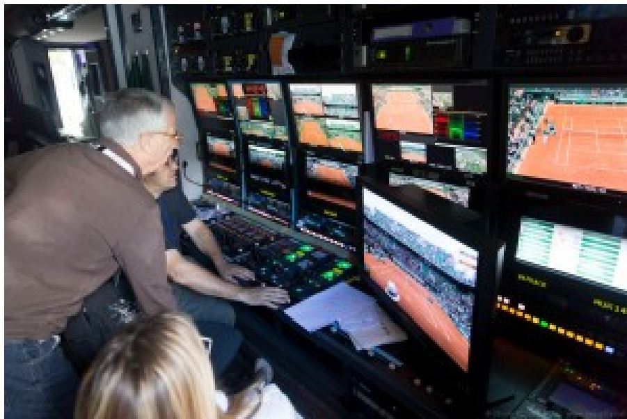
La zone des CCU (Camera Control Units) du car régie de France Télévisions avec la réception de signaux 4K. Le car est équipé en connectique SDI 3 gbits/s adaptable à la HD et à la 4K. Reste à passer à la fibre optique !

Pour la diffusion TNT , l'encodage était réalisé en 50p (images / secondes) avec une solution d'Envivio à 22 mbits/s avec un son en Dolby AC4 en 5.1 canaux, le résultat étant présenté sur un TV Samsung via une set-top-box utilisant un chipset STMicroelectronics, semble-t-il une première mondiale. Par comparaison, la TNT en HD utilise actuellement 8 mbits/s en DVB-T1. La diffusion était toujours réalisée à partir de la Tour Eiffel par TDF. Donc, pour les franciliens !