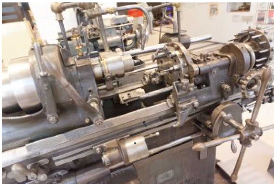
Une machine outil dans le musée des techniques de Vienne (Autriche), l'une des nombreuses machines de production visibles dans ce musée.

La première priorité pourrait être de commencer par ré-enchanter les jeunes aux sciences et les technologies et, au passage, féminiser ces métiers. Ces filières n'attirent plus autant les jeunes qu'avant. Certaines grandes écoles ont même du mal à recruter leurs élèves et à remplir leurs promotions. Ce n'est pas assez connu des familles qui sont impliquées dans les choix de cursus supérieur pour leurs adolescents à l'orée du Bac : entrer dans une école d'ingénieur est relativement facile quelle qu'en soit la voie choisie – via les classes préparatoires ou es voies latérales, via des formations supérieures courtes.