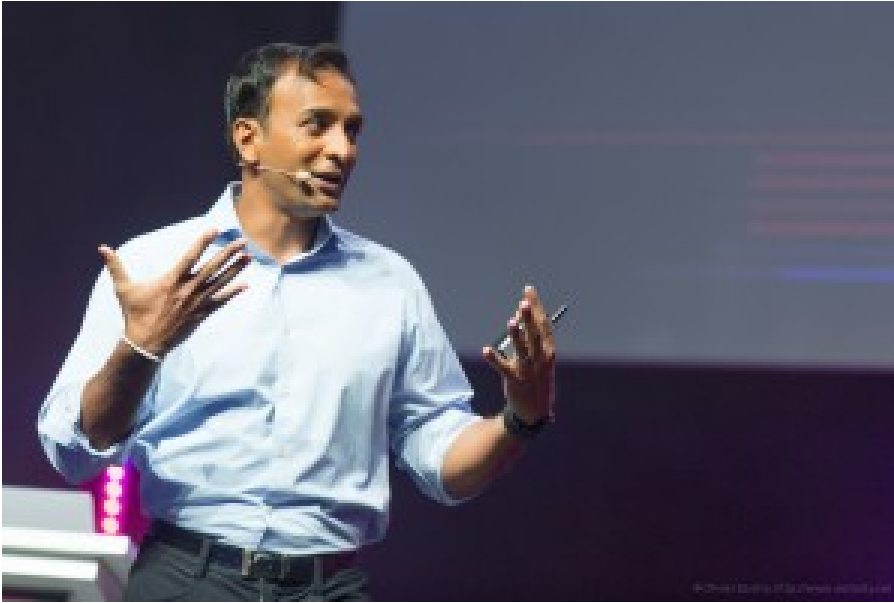
DJ Patil, le Chief Data Officer de la Direction Informatique de la Maison Blanche d'Obama. Qui n'a pas été remplacé depuis l'arrivée de Donald Trump, ce dernier ayant transformé la Maison Blanche en maison de blancs le 20 janvier 2017.

carcérale aux USA. 11,4 millions d'américains sont dans 3100 prisons et 23 jours en moyenne. Mais un tiers des prisonniers ont des problèmes mentaux et ne sont pas traités pour.