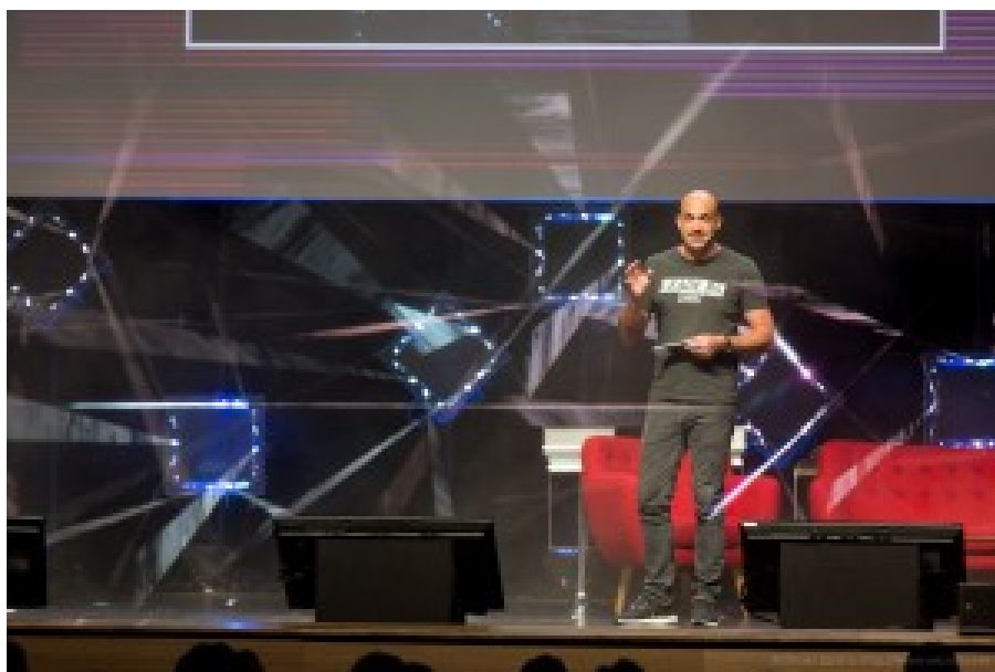
L'une des configurations des astucieux cadres laser de Minuit Une, une startup française.