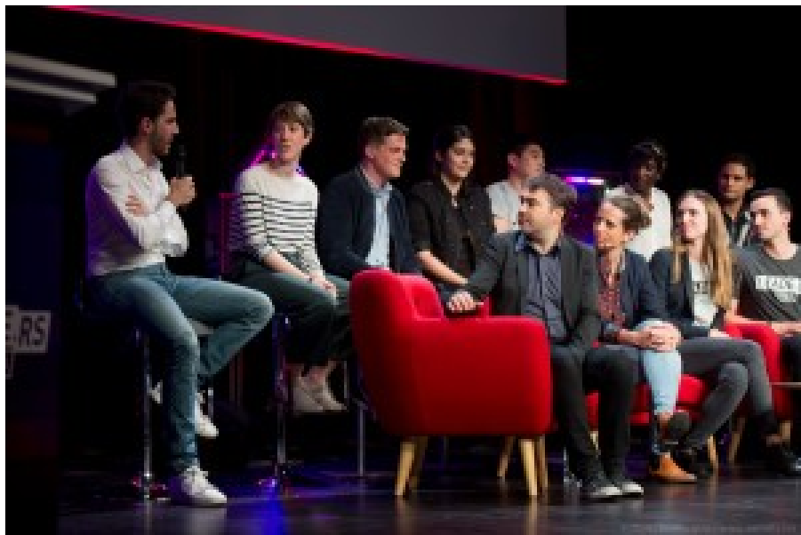
Les 8 entrepreneurs prometteurs sélectionnés parmi des centaines par un jury comprenant notamment Fred Mazella de Blablacar et Roxanne Varza de Station F.