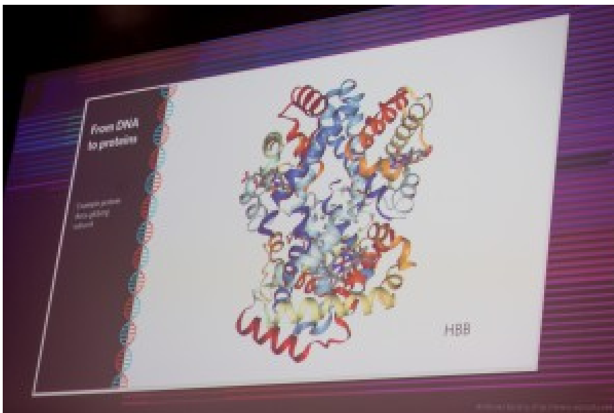
La protéine HBB sert à fabriquer l'une des composantes de l'hémoglobine. La startup Orionis Biosciences ambitionne de tester les liens entre nouveaux traitements et les sites actifs des protéines de ce genre.

Avec sa startup Orionis Biosciences qui a levé $4m et dont le site web est encore en construction, il ambitionne de faciliter ce processus de test en exploitant du machine et du deep learning. Le processus consiste à évaluer les interactions entre les 10 000 molécules connues et les protéines de nos cellules pour identifier des combinaisons nouvelles. Il évoque aussi l'usage du machine learning pour prédire le mode de repliement des protéines, un Graal critique pour pouvoir bidouiller le vivant. Ce genre de procédé est documenté par exemple dans Protein Secondary Structure Prediction Using Deep Convolutional Neural Fields , un article publié dans Nature en 2016. Vous pouvez visualiser Comment créer un homme avec son ADN ? , une intervention à TED de Sabatini où il explique de manière très vulgarisée le rôle du génome humain. Il illustre une capacité utilisant du ML à reconstituer un visage à partir d'un génome d'un individu et avec un résultat étonnant. Cela doit théoriquement servir à faire de la médecine personnalisée.